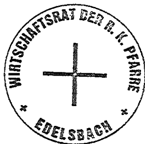
Siegel des Wirtschaftsrates